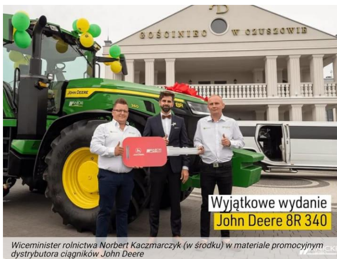
Wiceminister rolnictwa Norbert Kaczmarczyk (w środku) w materiale promocyjnym dystrybutora ciągników John Deere

Teść urządzi przyjęcie, będzie chwalił się zięciem, Traktor w ślubnym dostaniesz prezencie. Wart półtora miliona! Żona jest zachwycona. A ty? Zrobisz Polaków w balona.