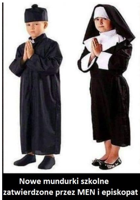
Nowe mundurki szkolne zatwierdzone przez MEN i episkopat

Są już tacy dyrektorzy, jak w Trójmieście, Co gruntować w szkole cnoty chcą niewieście. Wprowadzają dyrektywy Czarnka w życie I dziewczęta chętnie widzieć chcą w habicie.