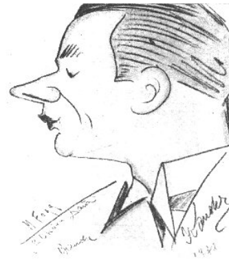
Mieczysław Fogg w karykaturze Władysława Kondora (1931)